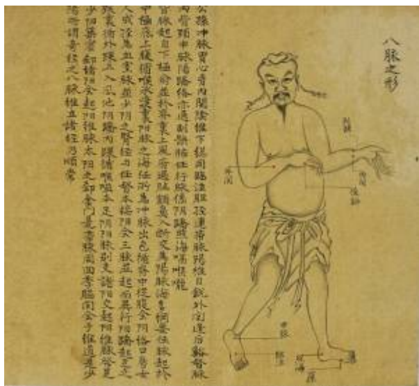
The chart shows the eight Meeting Points (huixue) of the Eight Extraordinary Channels, i.e. lieque (Break in the Sequence), neiguan (Inner Pass), waiguan (Outer Pass), houxi (Back Stream), shenmai (Extending Vessel), linqi (Close to Tears), zhaohai (Shining Sea) and gongsun (Grandparent and Grandchild). Ink drawing, Lingmen chuanshou tongren zhixue (The Lofty Portal Teaching Text of Acupoints on the Bronze Man. By: Unknown. Published: MS of Qing period (1644-1911).)